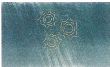
3 新沢327号墳の鉄刀の象嵌文様復元品