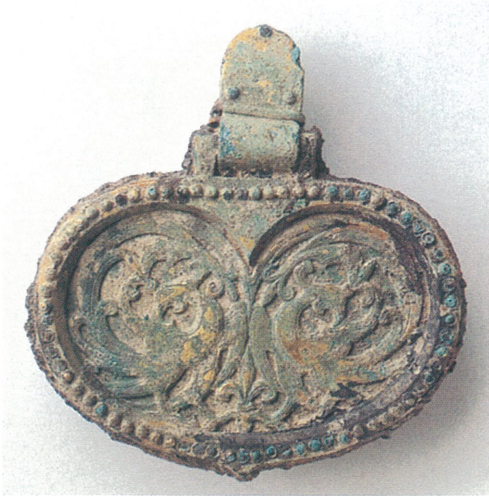
1 ウワナベ5号墳の輪鏡と復元品