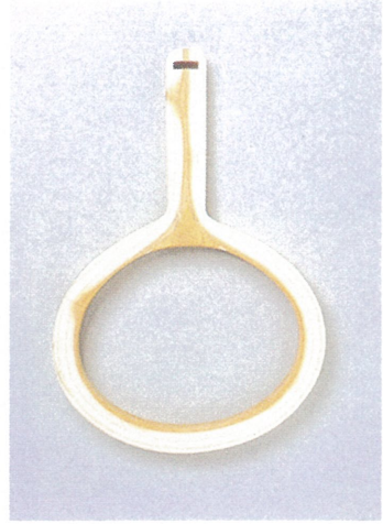
輪鏡 (木心部分の復元品)