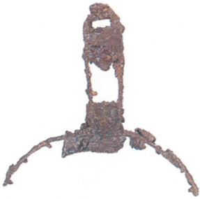
輪鏡 ウワナベ5号墳