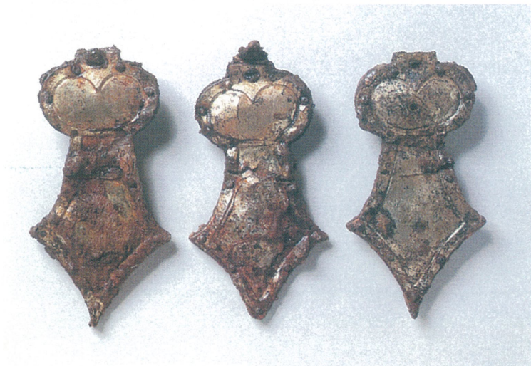
御所市石光山8号墳 剣菱形杏葉