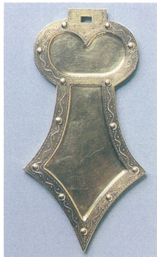
剣菱形杏葉（復元品）