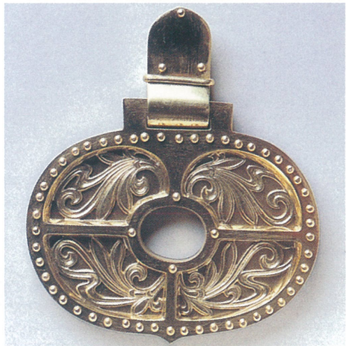
2 珠城山3号墳の杏葉と鏡板及びその復元品