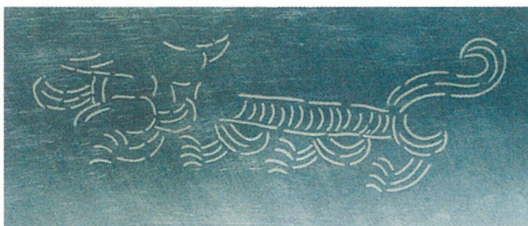
2 新沢327号墳の鉄刀の象嵌文様