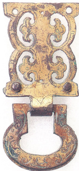
1 金銅製帯金具 広陵町新山古墳