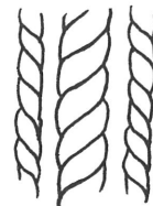
図2 漆塗膜の表面から見た紐の縀りの方向