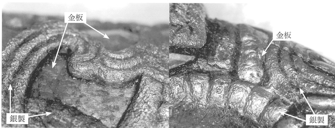
図2 玉田M3号墳の龍文装環頭大刀の環頭の部分1