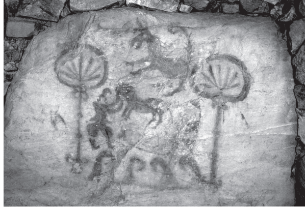
第2図 竹原古墳の奥壁

平福陶棺のレリーフと竹原古墳の彩色壁画とは、共通点と相違点とがある。共通点から述べるなら、まず指摘されるべきは、物語風画題が横方向ではなく、縦方向の3段に展開することである。陶棺の場合は物理的な制約があるため仕方がないが、広いスペースが採れるはずの装飾古墳でも縦方向になっていることは、6～7世紀の物語の表現方法が絵巻のように右から左への横方向ではなく、縦方向に重層化すべきものと認識されていた可能性も指摘できよう。この重層化した表現が、時間の推移なのか、共時的な累積なのかは定かではない。第2は動物と人物とが絡み合ったモチーフが見られる点である。具体的には、平福陶棺では手を上げた人物と四脚動物、竹原古墳では馬と武人がそれに当たる。銅鐸絵画など、装飾古墳以前にも動物と人物とが絡み合った文様があるから珍しいとは言えまいが、佐原眞が指摘したように原始絵画の特徴のひとつには、個々のモチーフが重なり合うことは少ないため、「人間が動物を曳く」という前後関係を前提とした画題が共通する点を、看過すべきではないだろう（注3）。ただし、旧石器時代のラスコー洞窟の彩色壁画の中にも2匹のバイソンが前後に重なり合った、遠近法の芽生えとも言うべき描画表現が認められるから、この点をあまり強調しすぎても良くない。第3は山や海などの自然物を抽象化した