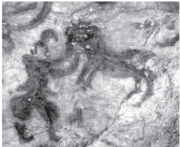
第3図 竹原古墳壁画に登場する馬を曳く人物