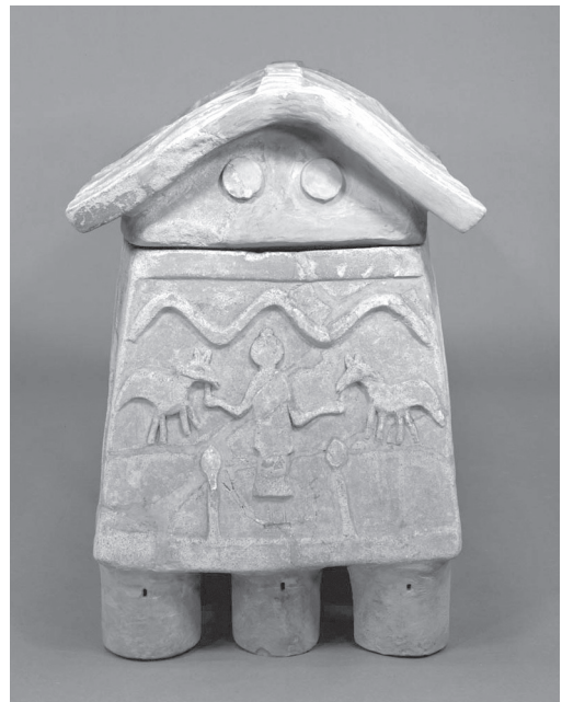
第1図 平福陶棺の小口面レリーフ (Image: TNM Image Archives) 九州国立博物館 装飾古墳データベース

陶棺に表された文様の品質形状は、次のとおりである。棺の蓋身の全体はベンガラが全面に塗布されて薄い橙褐色を呈し、問題の文様が表された部分は、上下端が粘土帯で区画されている。この中に描かれているのは、3つの頂点を持つ山形文、両手を広げた立像、人物に左右から向かい合う四脚動物、土筆（葱坊主？）のような有頭の直線文である。四脚動物は太い尾と短い耳が特徴的で、口に頭絡が回された家畜と推定されるが、種の詳細は定かではない。立像は顔が表現されておらず、両脚の表現も刻線で表されるに過ぎない。手は肩からだらりと垂れ下がり、あたかも左右から相対する動物にエサをあげているかのようだ。頭部は、仏頭を意識したかのようにコブ状の突起が表される。であるならば、下段の2つの尖頭の文様はハスの蕾を表したものだろうか。上段の山形文は、出土地が美作であることを考えると、山並みかもしれない。詳細なことは分からないけれども、小口面をひとつのキャンバスに見立ててこれら各種の具象文、幾何学文が配列されたことは疑いないだろう。任意の空間を意図的に切り取って、文様モチーフを計画的に配列することを物語と呼ぶならば、まさにこの装飾陶棺は、装飾古墳の中の物語風壁画と共通の思想で表されたと言っても過言ではない。その意味で、九州の装飾古墳研究の大枠を構築した森貞次郎が、この陶棺と福岡県宮若市竹原古墳の彩色壁画を比較したことは慧眼というべきである（注2）。