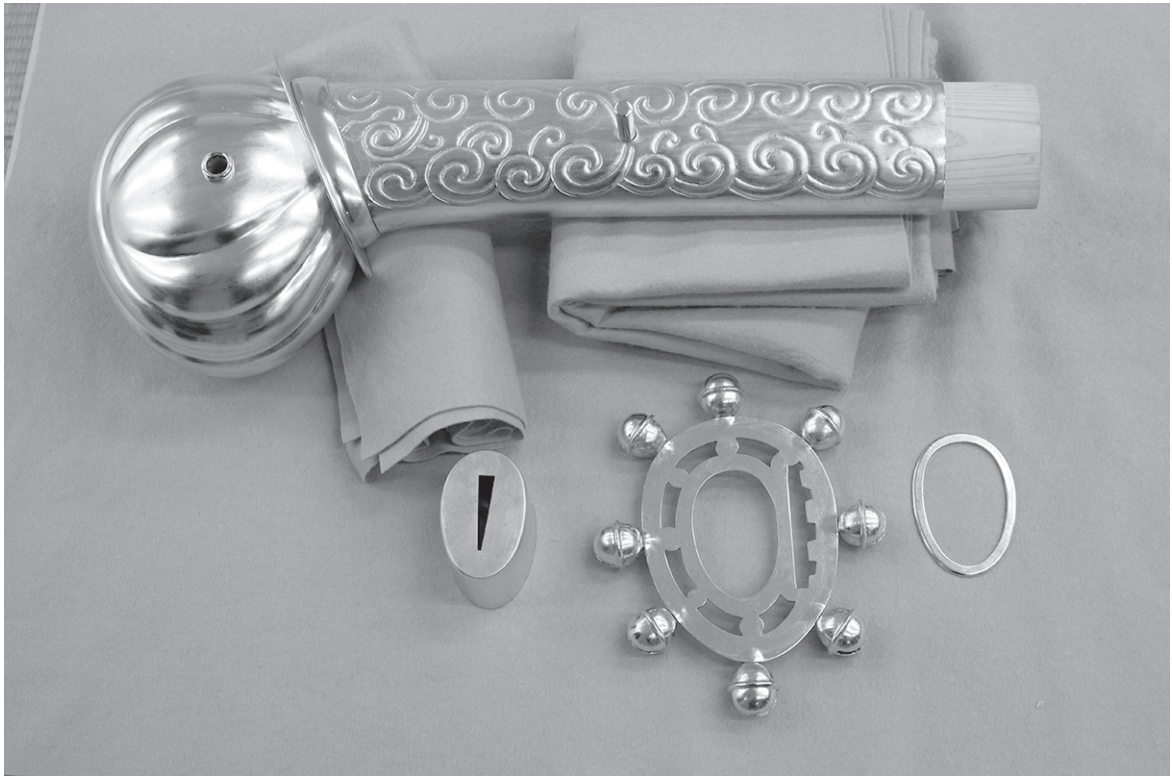
図版2 宮地嶽古墳出土大型頭椎大刀 復元品柄部分